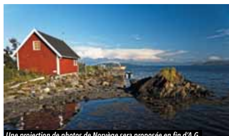
Une projection de photos de Norvège sera proposée en fin d'A.G.

Si les jours raccourcis vous rendent morose, rien de tel qu'une soirée festive pour vous redonner l'envie de faire des balades. Alors, rendez-vous le vendredi 9 décembre à 20h30 à la salle du Grand Calvaire pour l' assemblée générale de l'association des Sentiers Pédestres. À l'ordre du jour : bilan moral, renouvellement du bureau et projets 2017. Pour rire un peu, suivra un retour en images des sorties de l'année écoulée, puis pour se dépayser, une excursion au pays du Père Noël et son soleil de minuit ou encore celui où neige et feu se côtoient, sera proposée. La séance se terminera par le traditionnel verre de l'amitié.