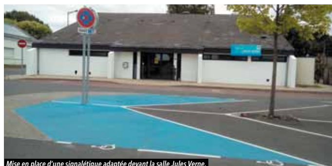
Mise en place d'une signalétique adaptée devant la salle Jules Verne.