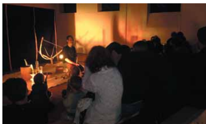
Samedi 22 octobre. Représentation du spectacle Mokofina, la fine bouche de la compagnie Lagunarte, dans le cadre du Tout-petit festival.