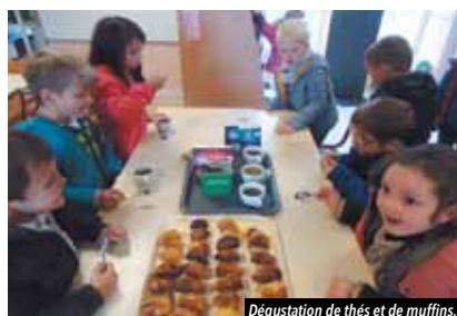
Dégustation de thés et de muffins.

Par exemple, les enfants de Grande Section ont « visité » Paris et Londres grâce à leur mascotte Titi la souris et à son amie Blanchette, et ont goûté différents thés et muffins.