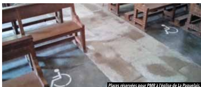
Places réservées pour PMR à l'église de La Paquelais.