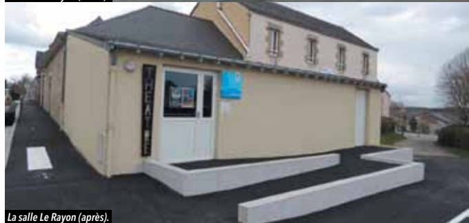
La salle Le Rayon (après).

- Élargissement du trottoir aux abords de la salle et installation d'un passage piéton conforme. L'accès latéral à la salle de