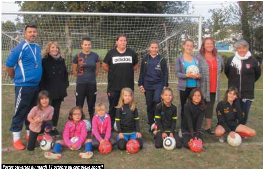
Portes ouvertes du mardi 11 octobre au complexe sportif

Le football féminin connaît un succès grandissant. Les portes ouvertes organisées par l'E.S. Vigneux attestent de ce phénomène avec de potentielles futures joueuses.