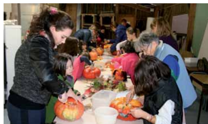
26 octobre. Atelier décoration de citrouille à l'Écomusée durant les vacances de La Toussaint.