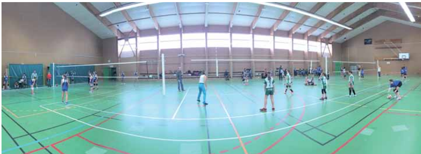
1 er octobre. Plateau benjamines réunissant 2 équipes de Vigneux Volley, 3 équipes de SNVBA, les Mouettes Pouliguenaises et l'USB.