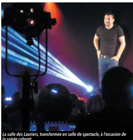
La salle des Lauriers, transformée en salle de spectacle, à l'occasion de la soirée cabaret.

Une fois de plus, la soirée cabaret du 22 octobre dernier, organisée par l'AGPV, a rencontré un vif succès.