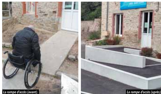
La rampe d'accès (avant).