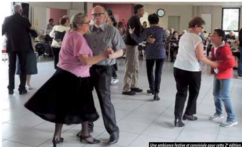
Une ambiance festive et conviviale pour cette 2 e édition.

Du 6 au 13 octobre, plus de 100 seniors de la commune ont participé aux activités organisées par le Centre Communal d'Action Sociale dans le cadre de la 2 e édition de la Semaine Bleue. Témoignages de quelques participants.