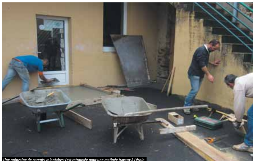
Une quinzaine de parents volontaires s'est retrouvée pour une matinée travaux à l'école.