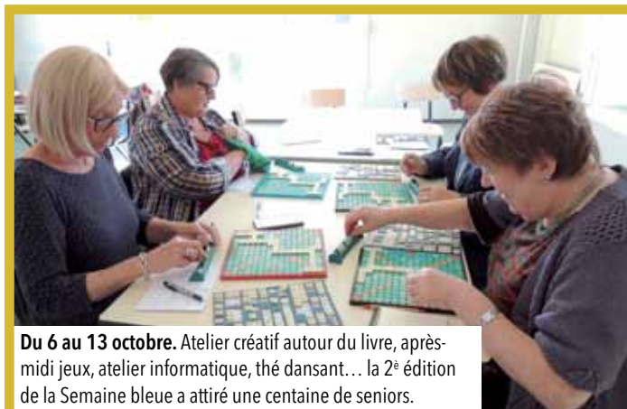
Du 6 au 13 octobre. Atelier créatif autour du livre, après-midi jeux, atelier informatique, thé dansant... la 2 e édition de la Semaine bleue a attiré une centaine de seniors.