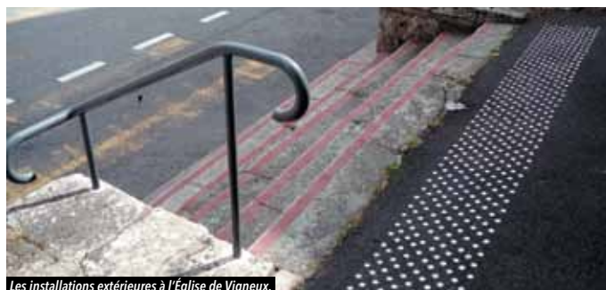
Les installations extérieures à l'Église de Vigneux.