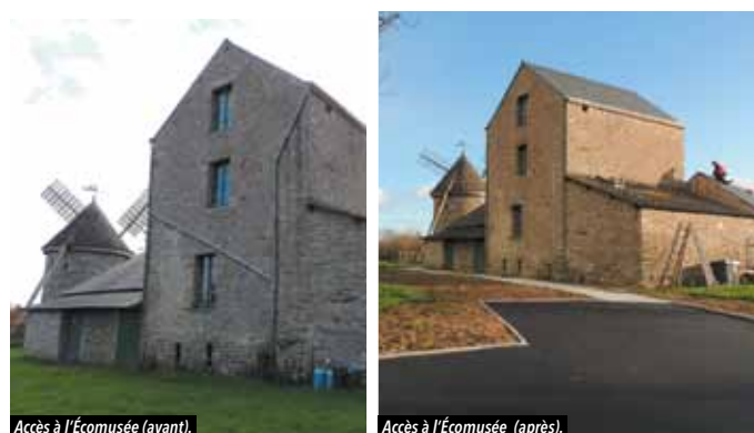
Accès à l'Écomusée (avant).