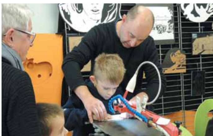
5 et 6 novembre. L'édition 2016 d'Artistes en fait a connu une forte affluence.