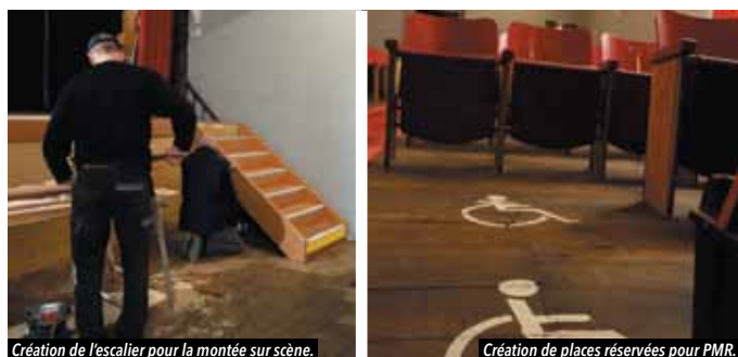
Création de l'escalier pour la montée sur scène.