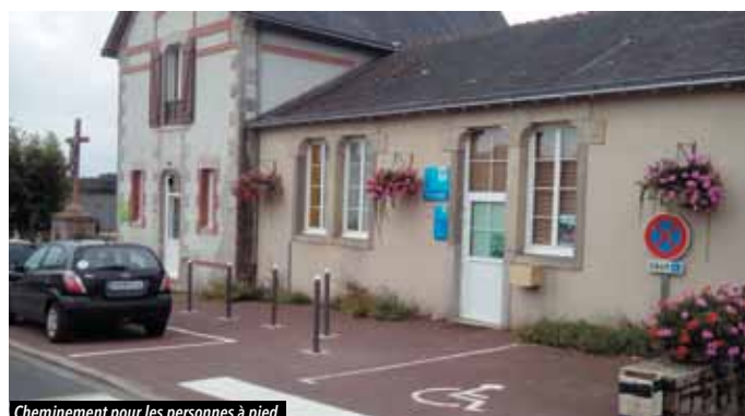
Cheminement pour les personnes à pied.