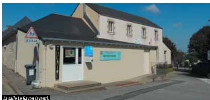
La salle Le Rayon (avant).