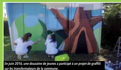
En juin 2016, une douzaine de jeunes a participé à un projet de graffiti sur les transformateurs de la commune.

Une exposition photo sur le projet mené avec les jeunes du S.A.V. sur les transformateurs de la commune sera proposée en mairie. L'exposition sera visible du 13 mars au 13 avril en mairie , elle se déplacera ensuite sur différents sites de la commune.