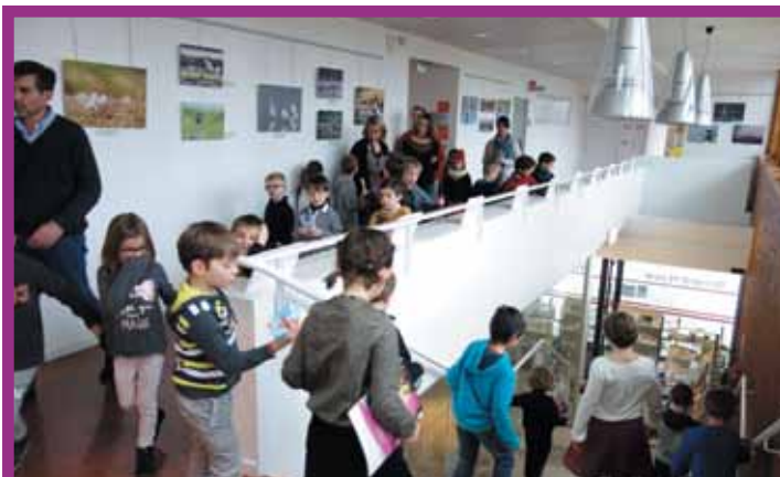
1 er et 8 février. Deux classes de CP du groupe scolaire Saint-Exupéry sont allées visiter la mairie dans le cadre de leur projet d'école visant à découvrir leur commune.