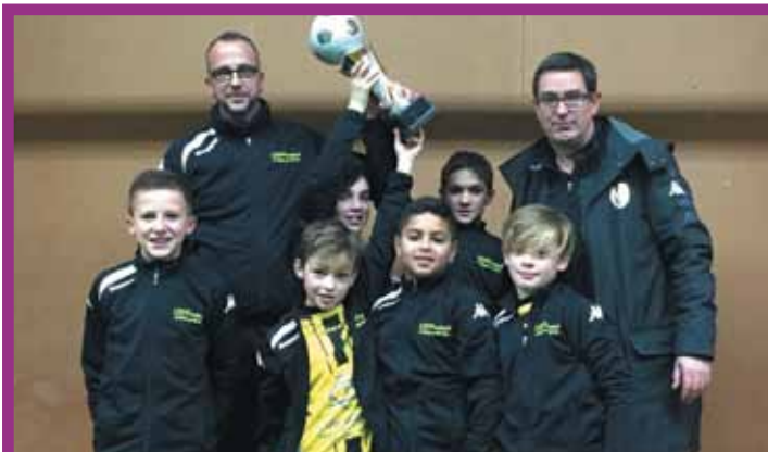
7 janvier. Plus de 200 joueurs de 10 à 13 ans ont participé au tournoi annuel du foot au complexe sportif. En photo, les équipes gagnantes en U11 (US Philibertine, à gauche) et U13 (US Bugallièrre, à droite).