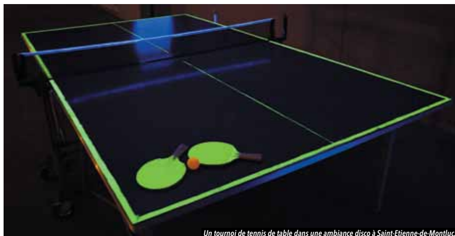
Un tournoi de tennis de table dans une ambiance disco à Saint-Etienne-de-Montluc.

Entre le Dark Ping et le « tournoi des trois raquettes », le tennis de table prouve, s'il en était besoin, sa vitalité et ses idées toujours renouvelées pour attirer le public.