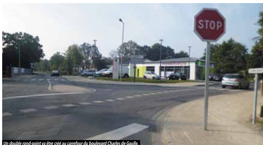
Un double rond-point va être créé au carrefour du boulevard Charles de Gaulle.

A près les travaux d'enfouissement des réseaux rue de Sévigné, l'aménagement de l'entrée sud-est du bourg de Vigneux se poursuit. Un double giratoire va être aménagé ce mois-ci à proximité de la maison de santé afin de sécuriser le carrefour et améliorer la visibilité. Les travaux commenceront fin février pour une durée d'environ un mois. Une déviation sera mise en place afin de permettre le bon déroulement des travaux.