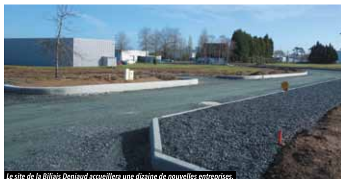
Le site de la Biliais Deniaud accueillera une dizaine de nouvelles entreprises.

Au total, c'est une superficie de 6,8 hectares qui a été créée et qui permettra d'accueillir une dizaine d'entreprises d'ici 2018.