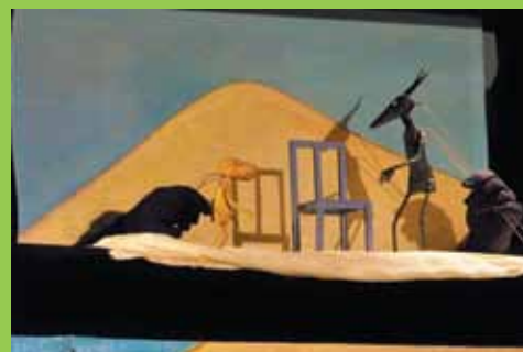
La compagnie Filou est venue présenter son spectacle aux élèves de maternelle.

De l'émerveillement, des rires, un peu de peur, et une bonne participation des enfants qui connaissaient les sujets pour avoir étudié les 4 albums en classe. Les enfants devraient se souvenir de cette belle rencontre.