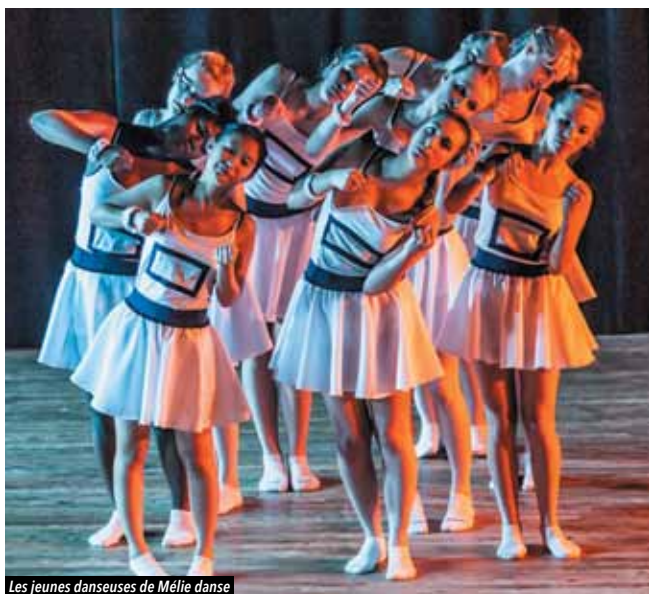
Les jeunes danseuses de Mélie danse

De nombreux évènements vont venir animer la fin de saison de Mélie Danse, avec en point d'orgue le fameux gala annuel, qui marquera fin mai les 30 ans de l'association.