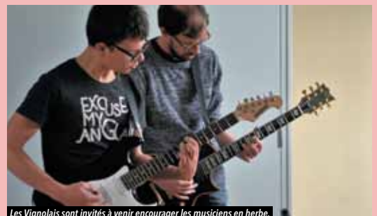
Les Vignolais sont invités à venir encourager les musiciens en herbe.

Comme tous les ans, Arpège a le plaisir de s'ouvrir au public vignolais à l'occasion de ses auditions :