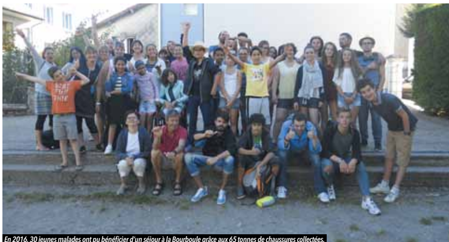
En 2016, 30 jeunes malades ont pu bénéficier d'un séjour à la Bourboule grâce aux 65 tonnes de chaussures collectées.

L'opération « Toutes pompes dehors » aura lieu du 6 au 17 mars. Objectif : offrir des vacances aux enfants malades.