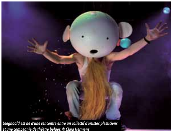
Leeghoofd est né d'une rencontre entre un collectif d'artistes plasticiens et une compagnie de théâtre belges.

Samedi 11 mars, la commune accueillera le spectacle Leeghoofd dans le cadre de la saison culturelle intercommunale « Hors Saison ». Un spectacle visuel et sonore qui met tous les sens en éveil.