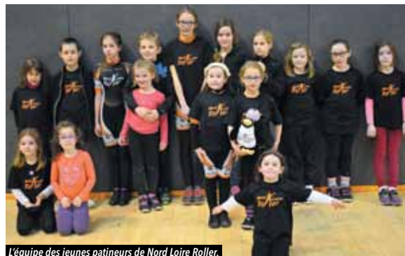
L'équipe des jeunes patineurs de Nord Loire Roller.