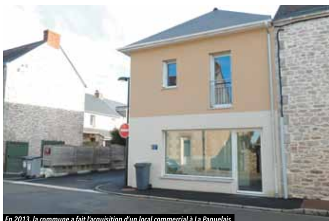
En 2013, la commune a fait l'acquisition d'un local commercial à La Paquelais.

Pour nous, c'était une belle opportunité, nous souhaitions rester sur la commune, idéalement située, mais cherchions à nous agrandir. Nous allons construire un bâtiment commun et pensons nous y installer début 2018.