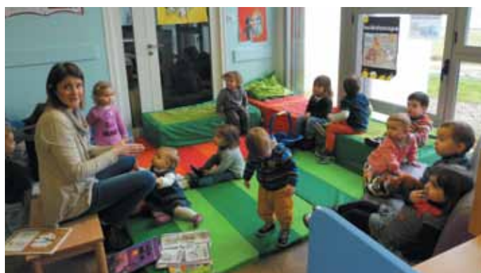
3 février. Les Ti 'Bouts ont fêté la Chandeleur autour de comptines en dégustant des crêpes cuisinées par leurs assistantes maternelles.