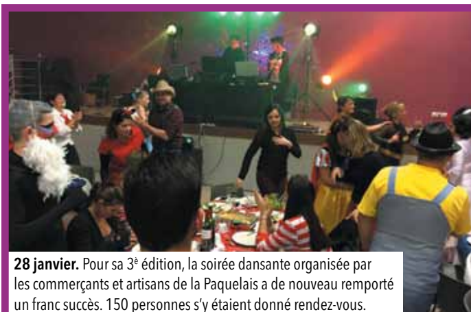
28 janvier. Pour sa 3 e édition, la soirée dansante organisée par les commerçants et artisans de la Paquelais a de nouveau remporté un franc succès. 150 personnes s'y étaient donné rendez-vous.