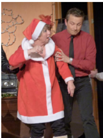
Retour sur « L'ARCHE DE NOËL » de Jean-Paul Cantineaux

« Imaginez que vous êtes Noël, le maire du village et justement, c'est la veille de Noël. Votre rez-de-chaussée est inondé, mais vous, vous avez un étage ! Le promoteur que vous attendez arrive mais a oublié les plans de votre projet de parc d'attraction. A cause de la crue, le préfet vous impose d'héberger les voisins, dont votre ex-femme et sa ménagerie ainsi qu'un vieil emmerdeur avec son déambulateur. Votre meilleure amie, la factrice, se retrouve elle aussi coincée chez vous et, pour passer le temps, elle ouvre et lit le courrier. Autre arrivée surprise : L'avant-centre international africain qui vient sauver le FC Nantes de la déroute.... »