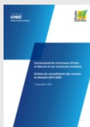
Schéma de mutualisation