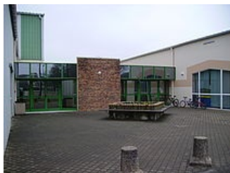
COMPLEXE FERNAND SASTRE