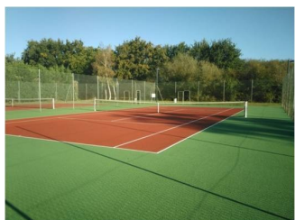
COURT DE TENNIS