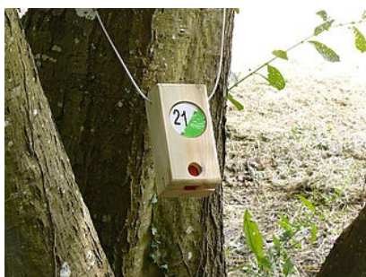
Parcours d'orientation du Plan d'eau du Tertre Rouge