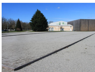
TERRAINS DE PETANQUE