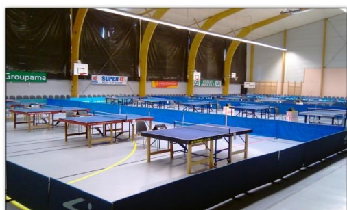
SALLE YANNICK NOAH