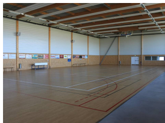
SALLE TONY PARKER